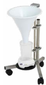
Support de débit urinaire