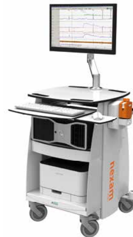
Nexam Pro - kabellose und professionelle Urodynamik

USA: Tel.: +1 802 857 1300 Email: usmarketing@laborie.com